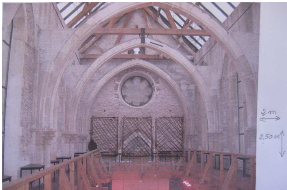
3 toiles « libres » de 2.50m de haut / 2m de large