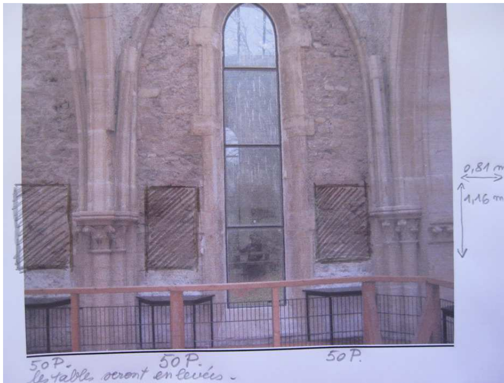
16 toiles (8 de chaque côté de la mezzanine) Format 50 P vertical